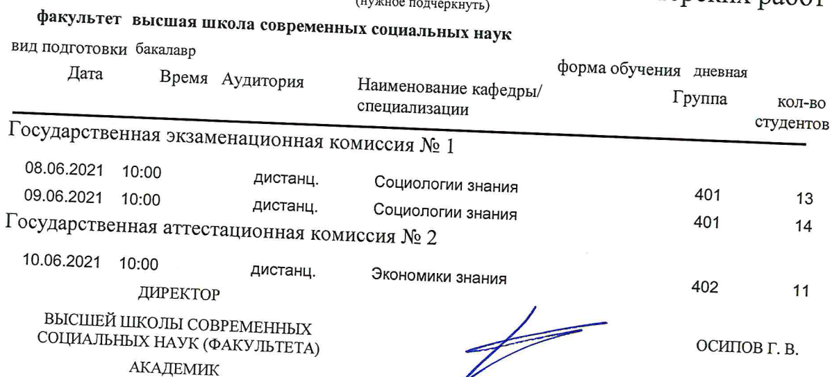
График защит дипломных/квалификационных/магистерских работ (нужное подчеркнуть)